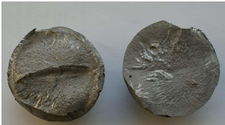
Рис. 2. Излом усталостного характера в шарах, не выдержавших испытания на ударную стойкость Fig. 2. Fatigue fracture in balls, balls that have not passed the impact resistance test

ких включений, скопления которых также обнаружены в изломах мелющих шаров (рис. 1, д ).