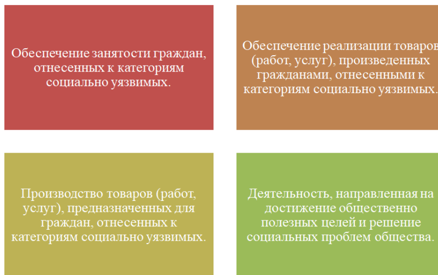
Рис. 4. Категории предпринимательской деятельности для получения статуса социального предприятия Fig. 4. Categories of entrepreneurial activity to obtain the status of a social enterprise

Стоит отметить, что для получения статуса социального предприятия (ИП) организация должна соответствовать условиям, установленным частью 1 статьи 24.1 ФЗ от 24.07.2007 № 209-ФЗ «О развитии малого и среднего предпринимательства в РФ» и осуществлять предпринимательскую деятельность, относящуюся к одной из четырех категорий (рис. 4).