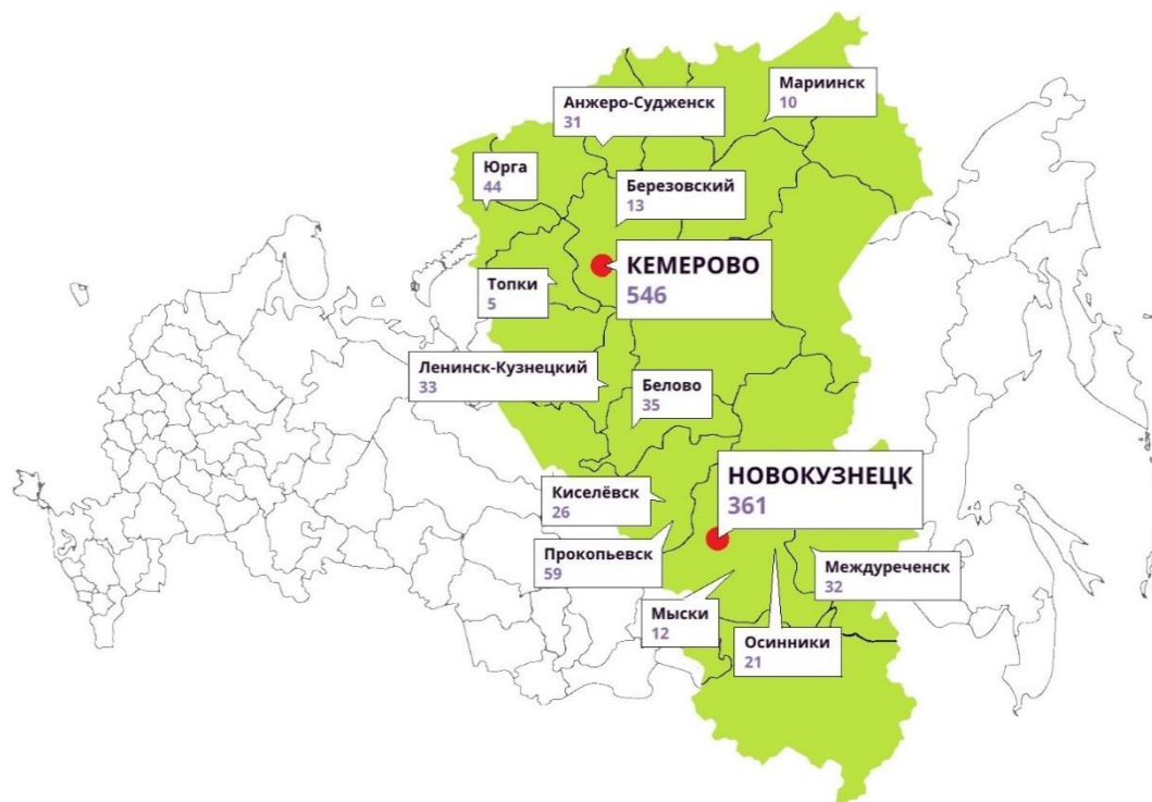
Рис. 2. Социальное предпринимательство в Кузбассе Fig. 2. Social entrepreneurship in Kuzbass

– 51 % предпринимателей развиваются в сфере здравоохранения, социального туризма, физической культуры и спорта;