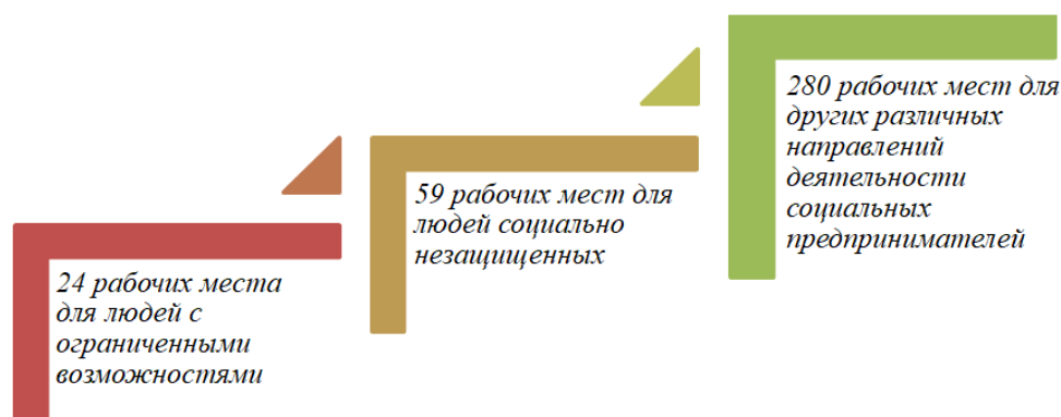
Рис. 3. Статистика создания рабочих мест в 2021 году социальными предпринимателями Fig. 3. Statistics on job creation by social entrepreneurs in 2021

С 1 января 2023 г. по 31 декабря 2025 г. для социальных предпринимателей в Кемеровской области снизят налоговую ставку с 15 до 5 %, если объектом налогообложения являются доходы, уменьшенные на величину расходов. С 6 до 1 % сократится ставка, если объект налогообложения – доходы. Мерой поддержки можно воспользоваться с 2024 г., оплатив налог за 2023 г. [21]. Важно понимать, что более 90 % социальных предпринимателей пользуются упрощенной системой налогообложения (УСН). Помимо вышеуказанных нововведений, социальные предприниматели также как и все регионы страны, могут претендовать на государственную поддержку, которая определена в Федеральном законе от 24.07.2007 № 209-ФЗ «О развитии малого и среднего предпринимательства в Российской Федерации».