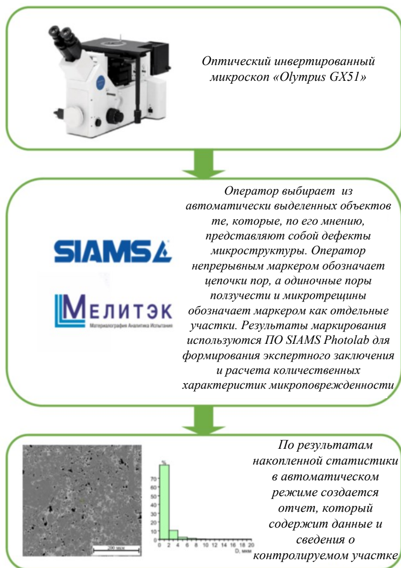
Рис. 2. Блок-схема методики исследования пористости сплавов Fig. 2. Block diagram of the method of studying the porosity of alloys

ние, без включений, равномерное распределение фаз. Значительные поры, трещины и несплошности отсутствуют.